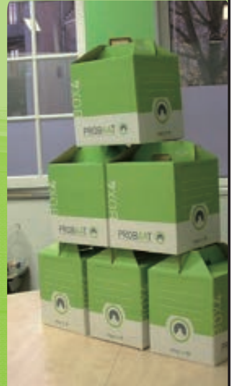
BOX 4 als een rots in de branding.

zijn aanmerkelijkbelang-aandelen verkoopt (en dus op die dag pas recht krijgt op de verkoopopbrengst), heffingsrente over de inkomstenbelasting over de verkoopwinst betalen met ingang van 1 juli 2009. Als hij met deze verkoop gewacht had tot 1 januari 2010, zou hij pas heffingsrente verschuldigd zijn geweest vanaf 1 januari 2011! Met ingang van 2010 verschuift namelijk het moment vanaf wanneer heffingsrente wordt berekend weer naar 1 januari van het volgende jaar. Aangezien de heffingsrente al enige tijd rond de 3 procent schommelt, kan dat een fikse besparing opleveren. •