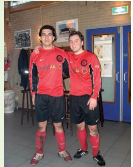
Het PROBAAT elftal van SV de Meer zondag 3, is gepromoveerd naar zaterdag 1