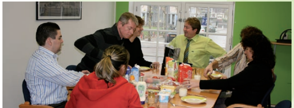
Tussen 12.30 en 13.00 wordt er bij ons altijd gezamenlijk geluncht. U bent van harte welkom om met ons een hapje mee te eten, indien u een afspraak bij ons op kantoor hebt rond het middaguur.

Doe het verzoek bij de laatste aangifte van het jaar, of direct na het vaststellen van de jaarrekening. De Belastingdienst kan het verzoek om teruggaaf weigeren indien u het te laat indient. •